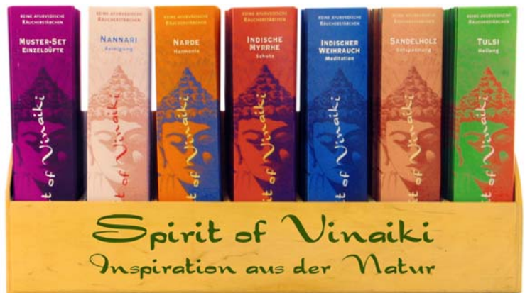
Nr. 3349 Display mit 7 Sorten